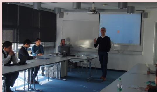
リュブリャナ大学社会科学部での講義の様子