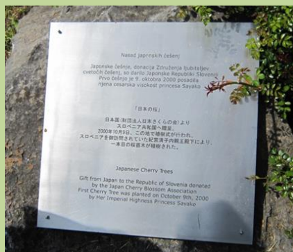
バイオテクノロジー学部敷地内の桜(上)と紀宮清子内親王殿下の植樹記念パネル(左)